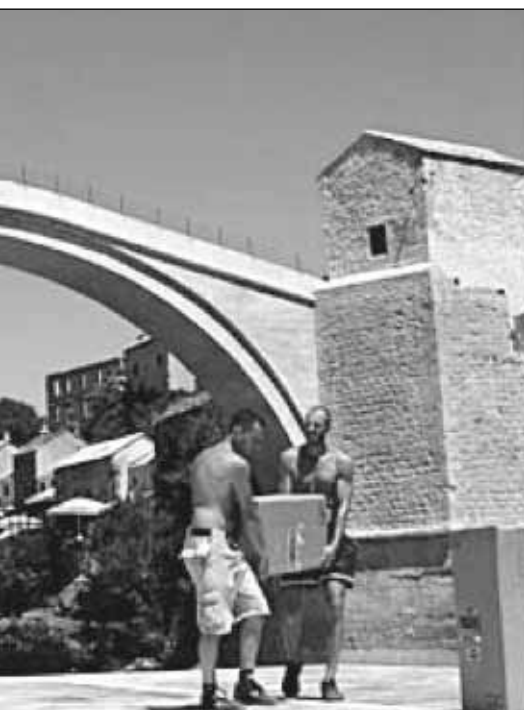
Η γέφυρα της Μόσταρ