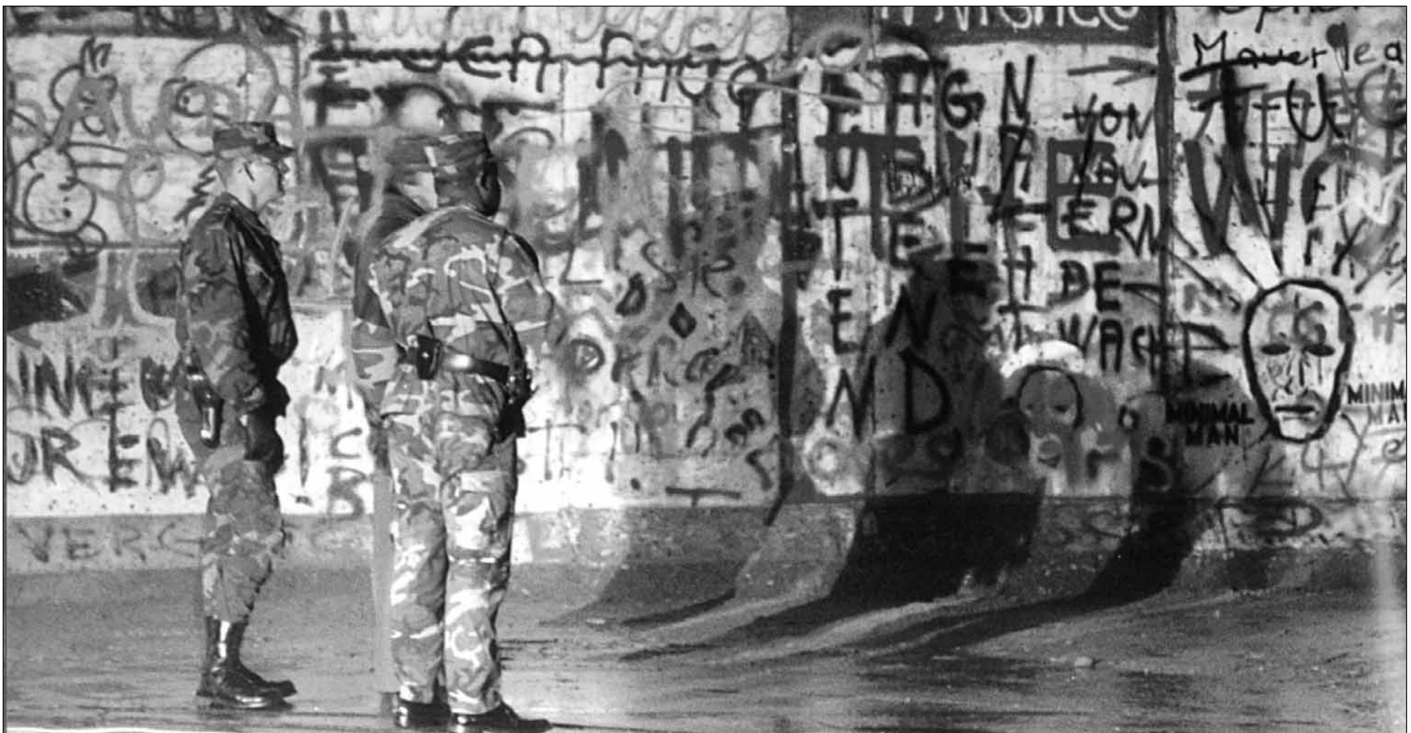
Το τείχος του Βερολίνου